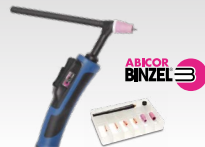
SR26DB - 4 m 038271